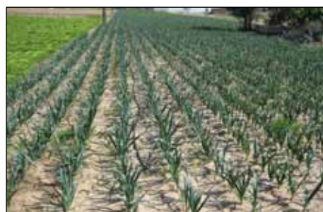
1. Camp de porros.

Tenint en compte les particularitats del nostre pla de Pineda i Pla de grau que és molt sorrenc, cal el rec més o menys sovint. Aleshores el pla estava farcit de pous amb sínies de tot tipus, la més habitual era de catúfols moguts per animals, matxos o cavalls. Més endavant ja van venir les bombes per pouar l'aigua dels pous, elèctriques o de gasolina. Passa el temps, la mata creix fins arribar a una mida comercial acceptable. El porro és