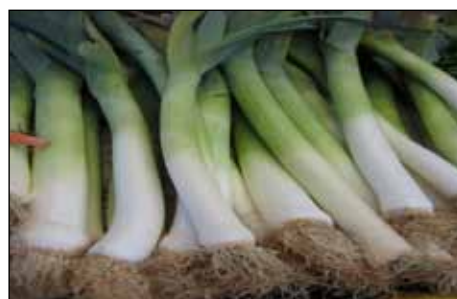
3. Porros Fesols tendres.