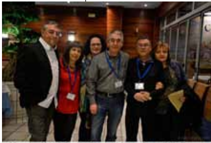
El Grup Amis d'eny de Sagelissa TV no s'és de l'últim d'ells ... @AliciaPons.com