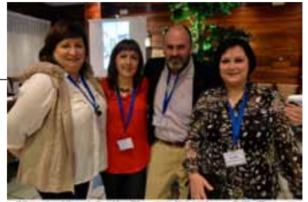
El Grup Amis d'eny de Sagelissa TV no s'és de l'últim d'ells ... @AliciaPons.com