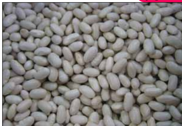
6. Fesols del ganxet

cal el rec més o menys sovint. Aleshores el pla estava farcit de pous amb sínies de tot tipus, la més habitual era de catúfols moguts per animals, matxos o cavalls. Més endavant ja van venir les bombes per poar l'aigua dels pous , elèctriques o de gasolina. Passa el temps, la mata creix fins arribar a enfilar-se per les canyes o a tapar tota la terra si és mongeta varietat nana, surten les flors de la fesolera, després les tavelles o bajoques. Si són per collir tendres com la varietat Perona, es van resseguint sovint i es porten al mercat. Si són per mongeta seca és deixa a la mata fins que queda seca.