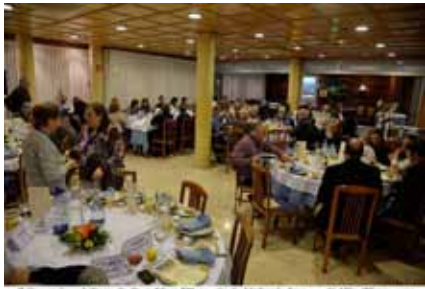
El Grup Amis d'eny de Sagelissa TV no s'és de l'últim d'ells ... @AliciaPons.com