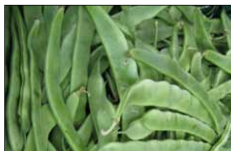
3. Fesols tendres.