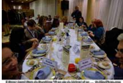
El Grup Amis d'eny de Sagelissa TV no s'és de l'últim d'ells ... @AliciaPons.com