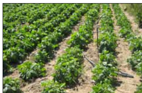
2. Fesol baix.