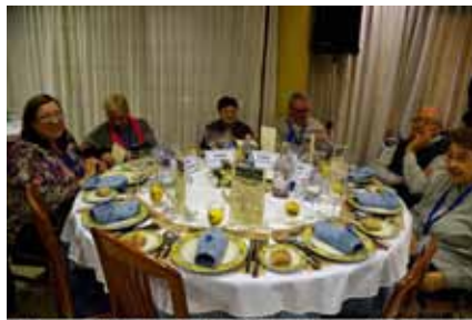
El Grup Amis d'eny de Sagelissa TV no s'és de l'últim d'ells ... @AliciaPons.com