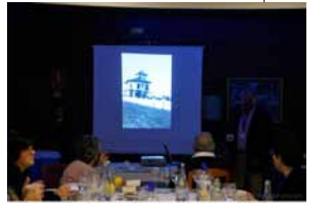
El Grup Amis d'eny de Sagelissa TV no s'és de l'últim d'ells ... @AliciaPons.com