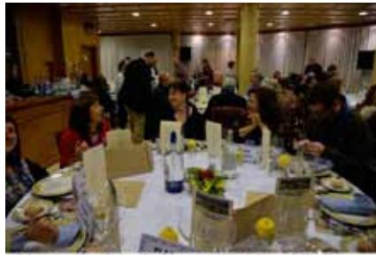
El Grup Amis d'eny de Sagelissa TV no s'és de l'últim d'ells ... @AliciaPons.com