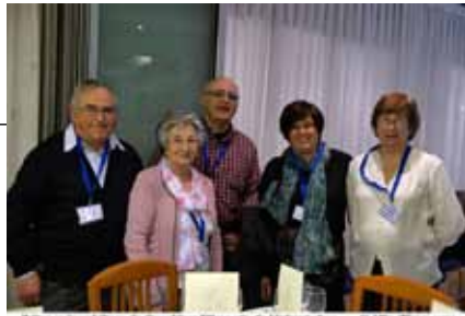
El Grup Amis d'eny de Sagelissa TV no s'és de l'últim d'ells ... @AliciaPons.com