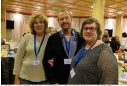
El Grup Amis d'eny de Sagelissa TV no s'és de l'últim d'ells ... @AliciaPons.com