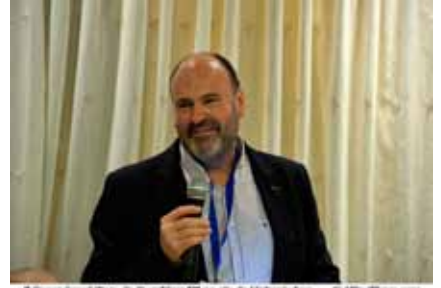
El Grup Amis d'eny de Sagelissa TV no s'és de l'últim d'ells ... @AliciaPons.com