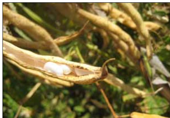
7. Fesols del ganxet a la mata.

cal el rec més o menys sovint. Aleshores el pla estava farcit de pous amb sínies de tot tipus, la més habitual era de catúfols moguts per animals, matxos o cavalls. Més endavant ja van venir les bombes per poar l'aigua dels pous , elèctriques o de gasolina. Passa el temps, la mata creix fins arribar a enfilar-se per les canyes o a tapar tota la terra si és mongeta varietat nana, surten les flors de la fesolera, després les tavelles o bajoques. Si són per collir tendres com la varietat Perona, es van resseguint sovint i es porten al mercat. Si són per mongeta seca és deixa a la mata fins que queda seca.