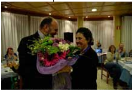
El Grup Amis d'eny de Sagelissa TV no s'és de l'últim d'ells ... @AliciaPons.com