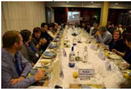
El Grup Amis d'eny de Sagelissa TV no s'és de l'últim d'ells ... @AliciaPons.com