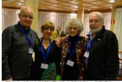
El Grup Amis d'eny de Sagelissa TV no s'és de l'últim d'ells ... @AliciaPons.com