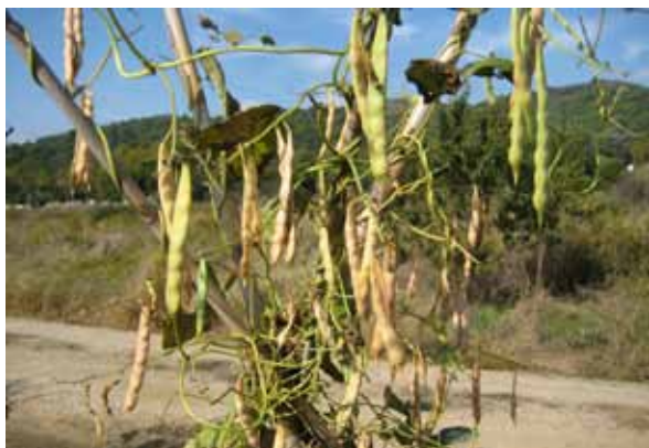
5. Abans de recollir.