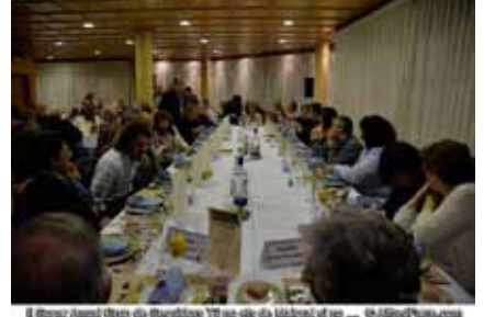
El Grup Amis d'eny de Sagelissa TV no s'és de l'últim d'ells ... @AliciaPons.com