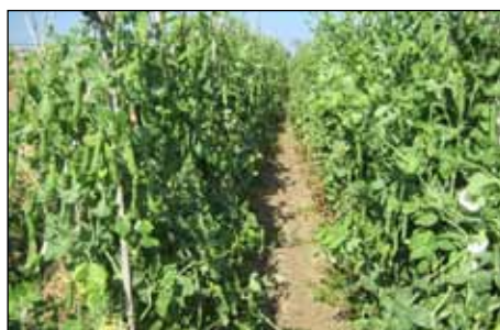
Pesolar al Pla de Grau

Quan les pesoleres tenen un o dos pams, cal clavar canyes vora de cada planta en forma d'encreuat i lligar-les de quatre en quatre, també cal lligar la planta a la canya de tant en tant. Primer apareixen unes flors blanques d'on surt la baina del pèsol, als temps de la collita es separen les bagotes de la planta per consumir el pèsol tendre. El pagès deixa les bagotes més desenvolupades i les últimes per