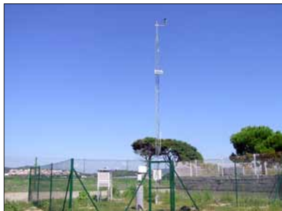
Actual estació meteorològica automàtica de Malgrat (des de 2005), instal·lada al costat de les pistes d'atletisme.