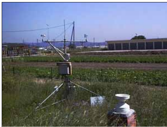
Primera estació meteorològica automàtica de Malgrat (1990-2005), instal·lada als terrenys de la Cooperativa agrícola El Progrés-Garbí.

En situacions de calma atmosfèrica, les planes interiors de la conca de la Tordera es refreden considerablement. Com que el mar és més càlid, aquest aire fred i més pesat flueix seguint la vall de la Tordera i arriba a Malgrat i Blanes. Per aquest motiu, a les nits molt sovint es noten els vents de terrals i les temperatures baixen a valors insòlits a d'altres punts del litoral. Aquest hivern, per exemple, la primera glaçada arran de mar a Catalunya s'ha registrat a Malgrat: -0,8°C de mínima el dia 10 de desembre. Però si volem el valor més baix registrat al nostre municipi hem d'anar a l'onada de fred del febrer de 2012: el dia 5 es va mesurar una mínima de -7,3°C.