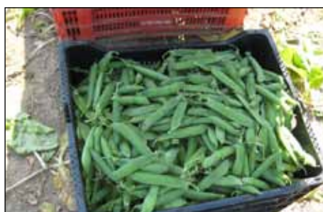
Pesols a la caixa