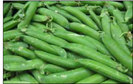
Pesols al mercat

aconseguir pèsol sec. Quan la mata s'ha assecat, es procedeix a batre les mates picant-les amb unes forques a l'era o ara damunt d'una lona impermeable, es treuen les mates i queda el pèsol, que pot ventar-se al vent i envasar-lo en petits sacs per vendre o per guardar-lo de llavor pel proper any. La comarca del Maresme, per la seva climatologia és adequada pel conreu del pèsol, recordem les pesolades dels restaurants del Maresme on condimenten el pèsol amb sèpia, pop o altres ingredients típics de temporada.