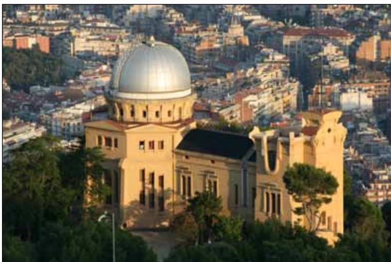
Observatori Fabra. Vista de l'edifici des de la muntanya del Tibidabo.

tàndem amb l'astrònom Josep Comas i Solà en la direcció del Fabra.